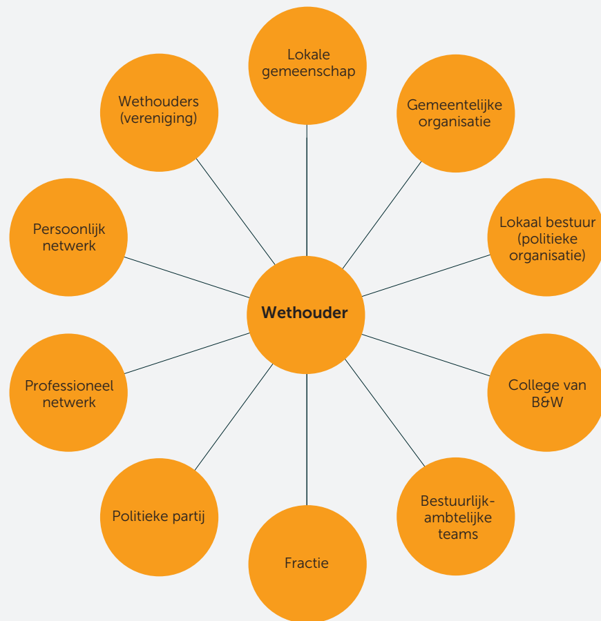
Figuur 1 Sociale systemen (groepen) waar een wethouder deel van uitmaakt en zich toe verhoudt.