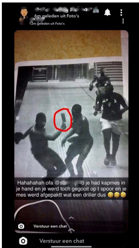
Figuur 2 Screenshot van post op Snapchat