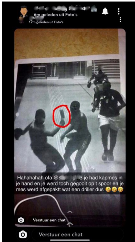
Figuur 2 Screenshot van post op Snapchat