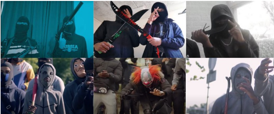
Figuur 1 Wapens in Nederlandse drillvideo’s

Bovendien gebruiken Nederlandse drillrappers afbeeldingen van buurten in hun muziekvideo’s om hun authenticiteit vorm te geven. De drillvideo’s uit Amsterdam, Rotterdam en Den Haag geven zicht op straten, bakstenen muren, hekken, bruggen, lokale parkeergarages, parken, winkels en sportvelden – allemaal herkenbare plekken die de plaatsen waar deze drillrappers vandaan komen symboliseren. Bovendien staan de specifieke delen van de stedelijke context waar deze video’s zijn opgenomen – zoals Amsterdam-Zuidoost, Rotterdam-Zuid en Den Haag-Oost – bekend om hun criminaliteitsproblemen en bredere maatschappelijke uitdagingen, zoals lage inkomens, sociale spanningen, kwetsbare groepen, een hoge prevalentie van gezondheidsproblemen onder de inwoners en een hoge schooluitval. De hyperlokaliteit in de video’s laat zien dat drillrappers de nadruk leggen op de territoriale stigma’s die rusten op de buurten waar zij vandaan komen, in overeenstemming met de observatie van Anderson (1999, p. 77) dat ‘people are likely to assume that a person who comes from a “bad” area is bad’.