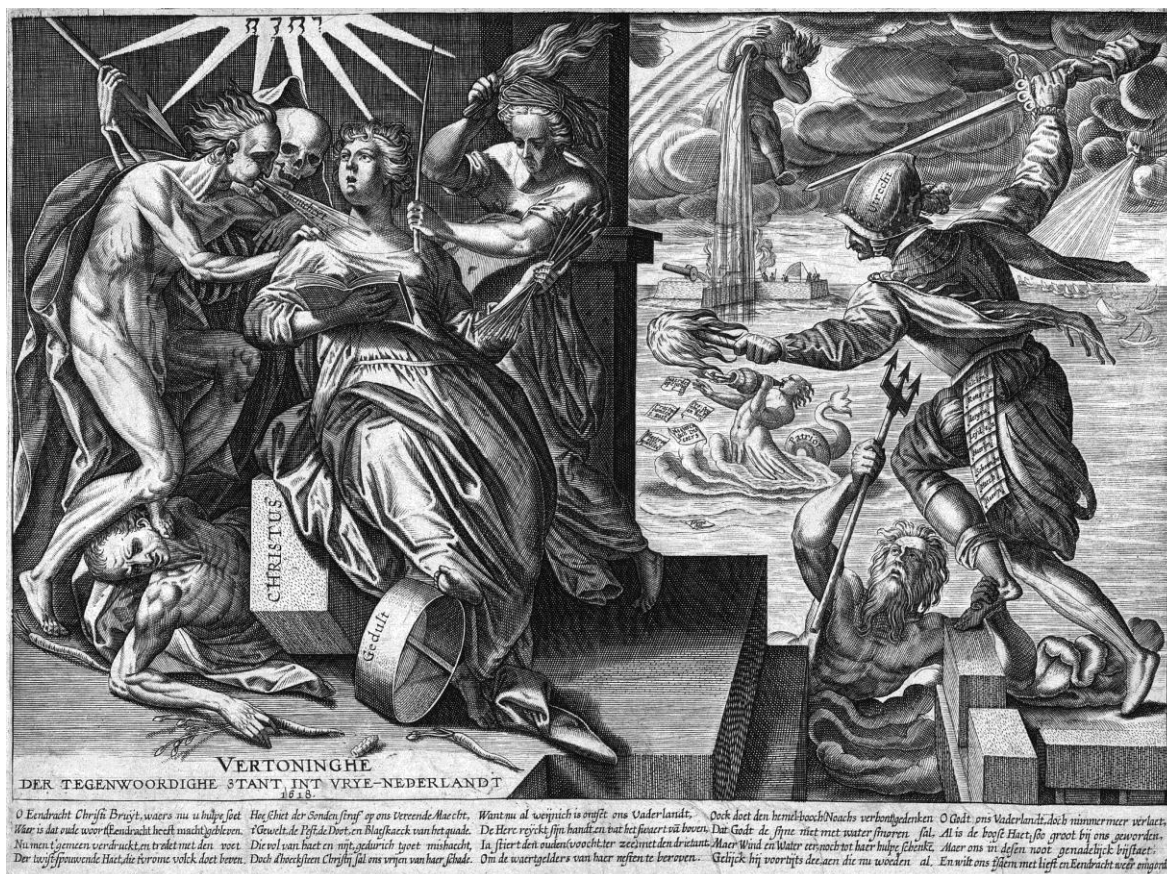
Vertoninghe der tegenwoordighe stant int vrye-Nederlandt, 1618 (Bijzondere Collecties, Universiteit van Amsterdam, OTM: Pr. H 61)

aanleiding van het ontzet van Leiden. 5 De vrouw is de Leidse stedenmaagd, belaagd door hongersnood, dood, pest, en de Spanjaarden, de soldaat. De zeewezens, het water, de wind en de regen tonen op welke manier uiteindelijk het Spaanse leger voor Leiden in 1574 werd verdreven: de doorgestoken dijken, het stijgende water en de wind die de vloot van de prins richting de stad blies. 6