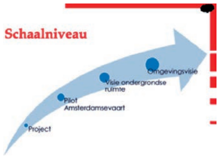
Afbeelding 1: de Leeromgeving ingebed in de planvormingsprocessen.

In de Leeromgeving is het pilotgebied Amsterdamsevaart als casus benut omdat deze pilot bouwstenen moet aandragen voor een samenhangende visie op de ondergrondse ruimte voor de gehele stad. Deze visie kan in een later stadium gebruikt worden als bouwsteen voor een Omgevingsvisie. Dit is verbeeld in onderstaande figuur, waarbij de Leeromgeving is aangeduid als ‘project’.