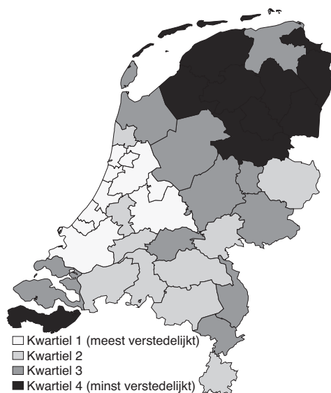
Figuur 1. Mate van verstedelijking COROP-regio's.

van verstedelijking en hoe het aandeel ouderen in deze regio's zich heeft ontwikkeld. Daarnaast beschrijf ik veranderingen in de mate waarin ouderen in sterk verstedelijkte of juist in landelijke regio's wonen. Ik gebruik hiervoor data van het Centraal Bureau voor de Statistiek (CBS) op het niveau van de COROP-regio. Nederland bestaat uit 40 van dergelijke regio's, vernoemd naar de Coördinatie Commissie Regionaal OnderzoeksPro-